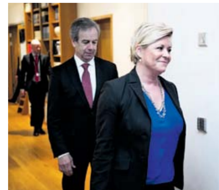
KRISER VIL KOMME: Og da kan vi nordmenn kose oss med tanken på at Siv Jensen ikke er påholden med oljefondpengebruken selv om Øystein Olsen allerede vanskelig kan senke renten mye.