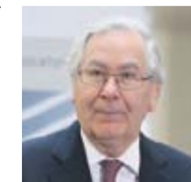
GOD BOK: Mervyn King har kanskje skrevet den meste tankevekkende boken om pengepolitikk etter finanskrisen.